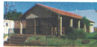
MUSEU MONSENHOR ESTANISLAU WOLSKI

Aprovado por unanimidade de em maioria absoluta.