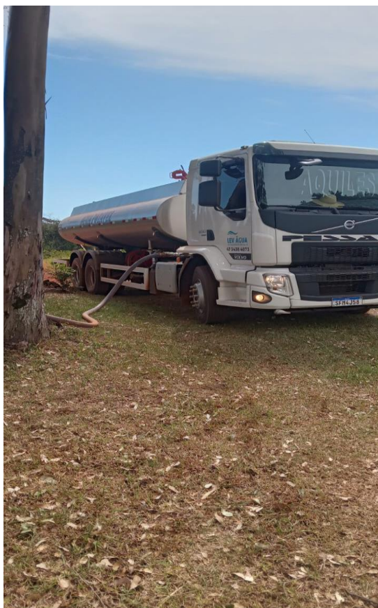
Foto 15, 16 e 17: Caminhão abastecendo caixas de água no interior do município